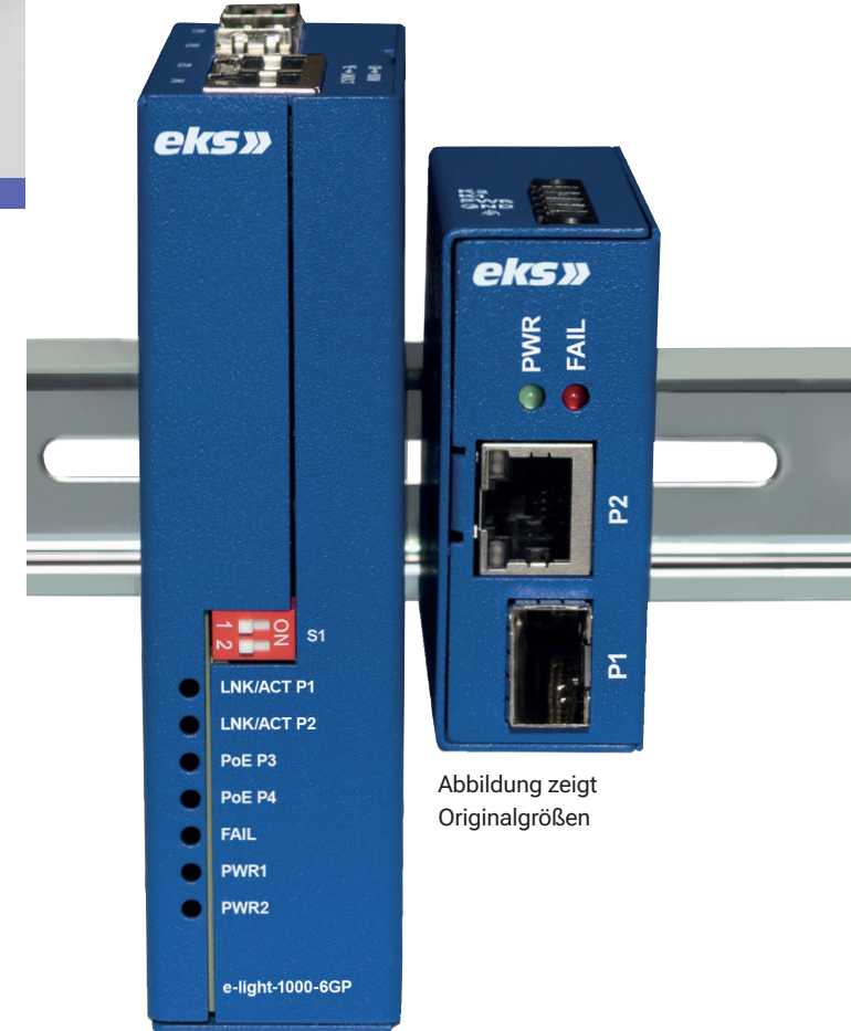
Abbildung zeigt Originalgrößen